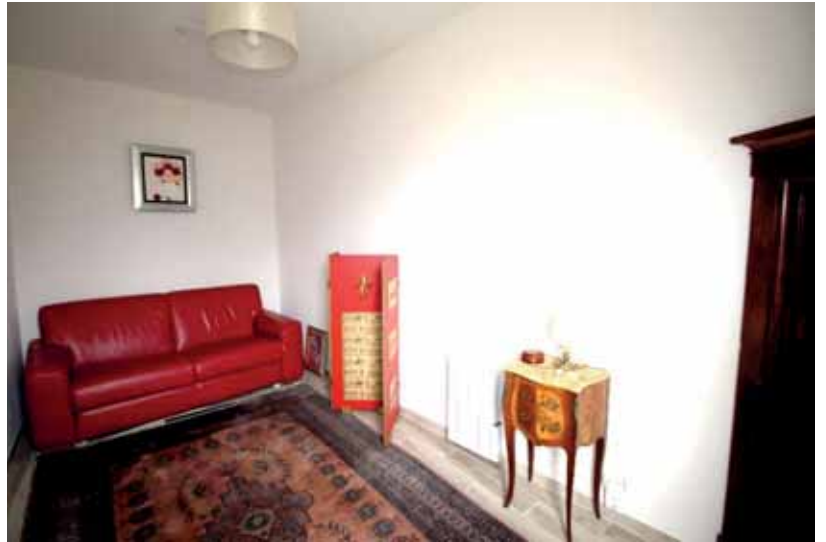
-Salle de réception de 40 m 2 (réception, formation, ou atelier d'artiste)